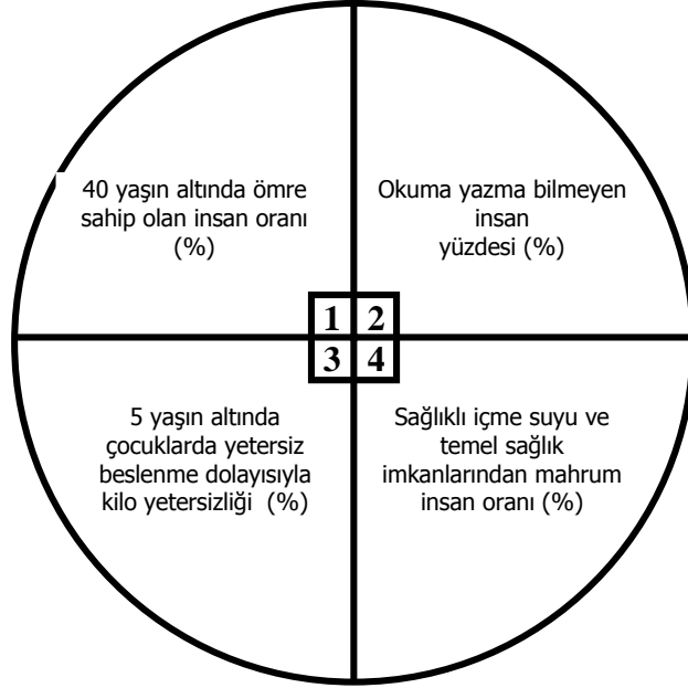
(Gelişmiş Ülkeler İçin)